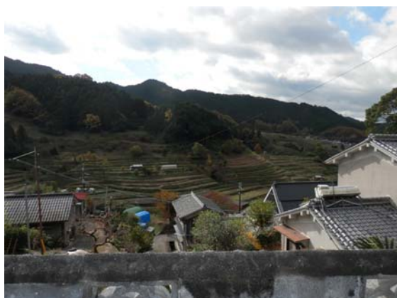
( 物件からの風景 )