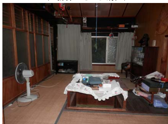
( 6畳和室 )