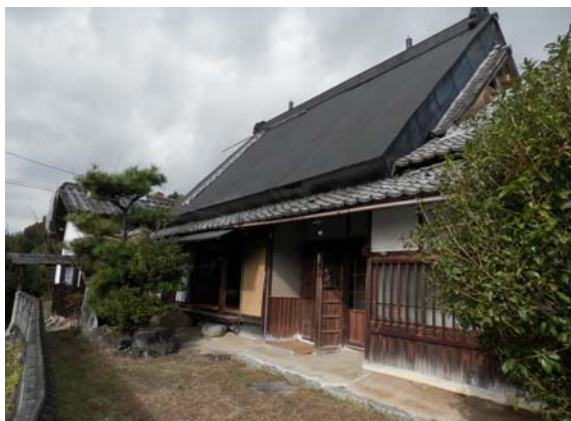
( 外 観 )