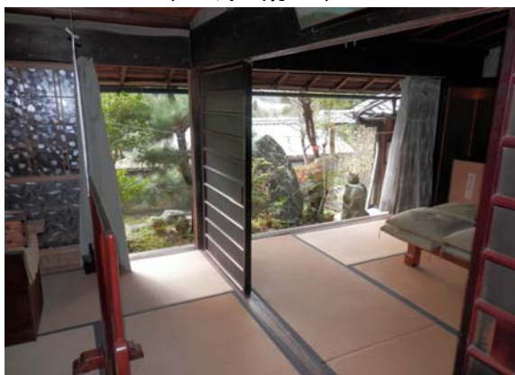
( 4畳和室 8畳和室 )