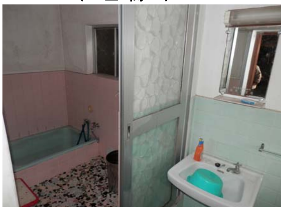
( 脱衣所・浴室 )