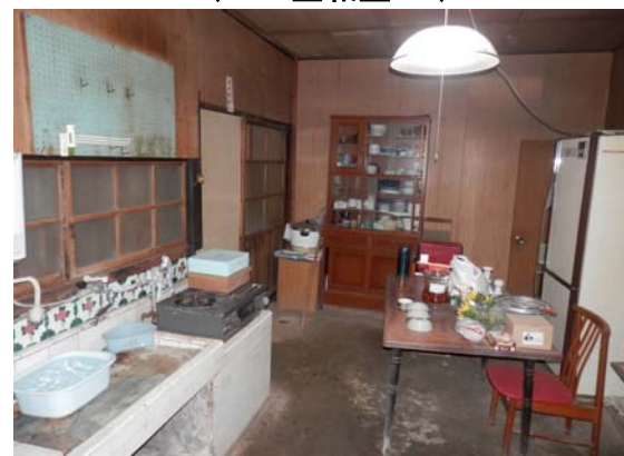
( 台所・土間 )