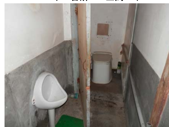
( ト イ レ )