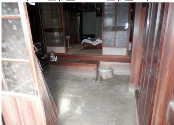
( 土 間 )